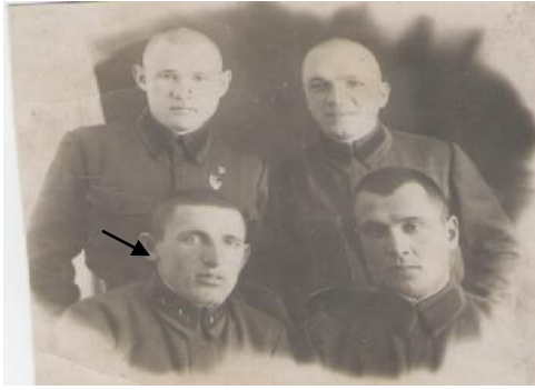
(1941г, танковое училище)

После окончания учебы вся группа сразу была отправлена на фронт. Всю войну он прошел на танке Т 34 в звании лейтенанта, был командиром экипажа.